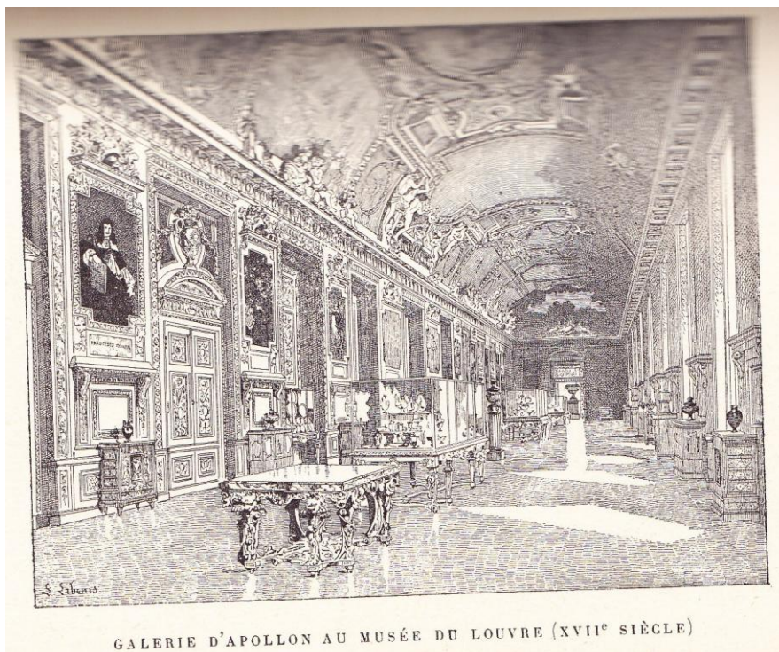
GALERIE D'APOLLON AU MUSÉE DU LOUVRE (XVII e SIÈCLE)

CHAMPEAUX , Les Monuments de Paris (1880) : « Galerie d'Apollon au musée du Louvre » (« époque de la Renaissance »)